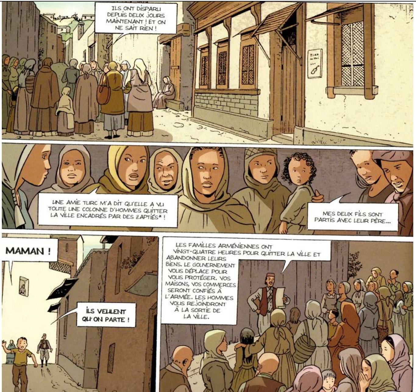
Document n°1 : « Le cahier à fleurs » par L. Galandon et V. Nicaise – Editions Bamboo