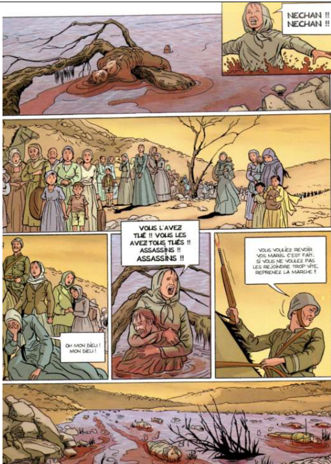
Document n°1 : « Le cahier à fleurs » par L. Galandon et V. Nicaise – Editions Bamboo