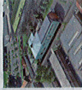
ARCHIVES DÉPARTEMENTALES, lieu du spectacle

Samedi 15 novembre à 18 h 30 aux Archives départementales du Nord au 22 rue St Bernard. Entrée libre et gratuite. Séance unique.