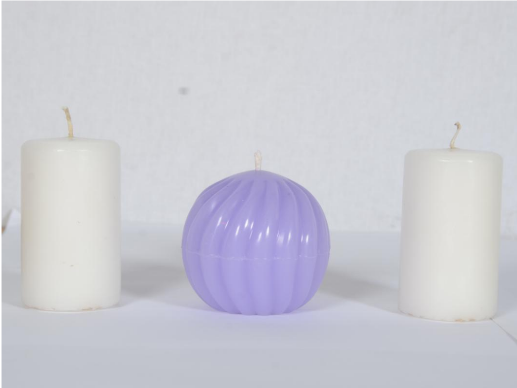
Bougies en cire