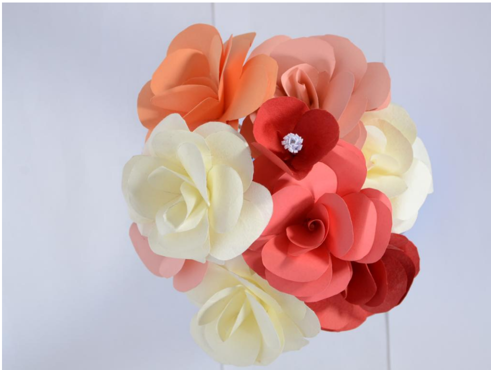
Roses réalisées en papier