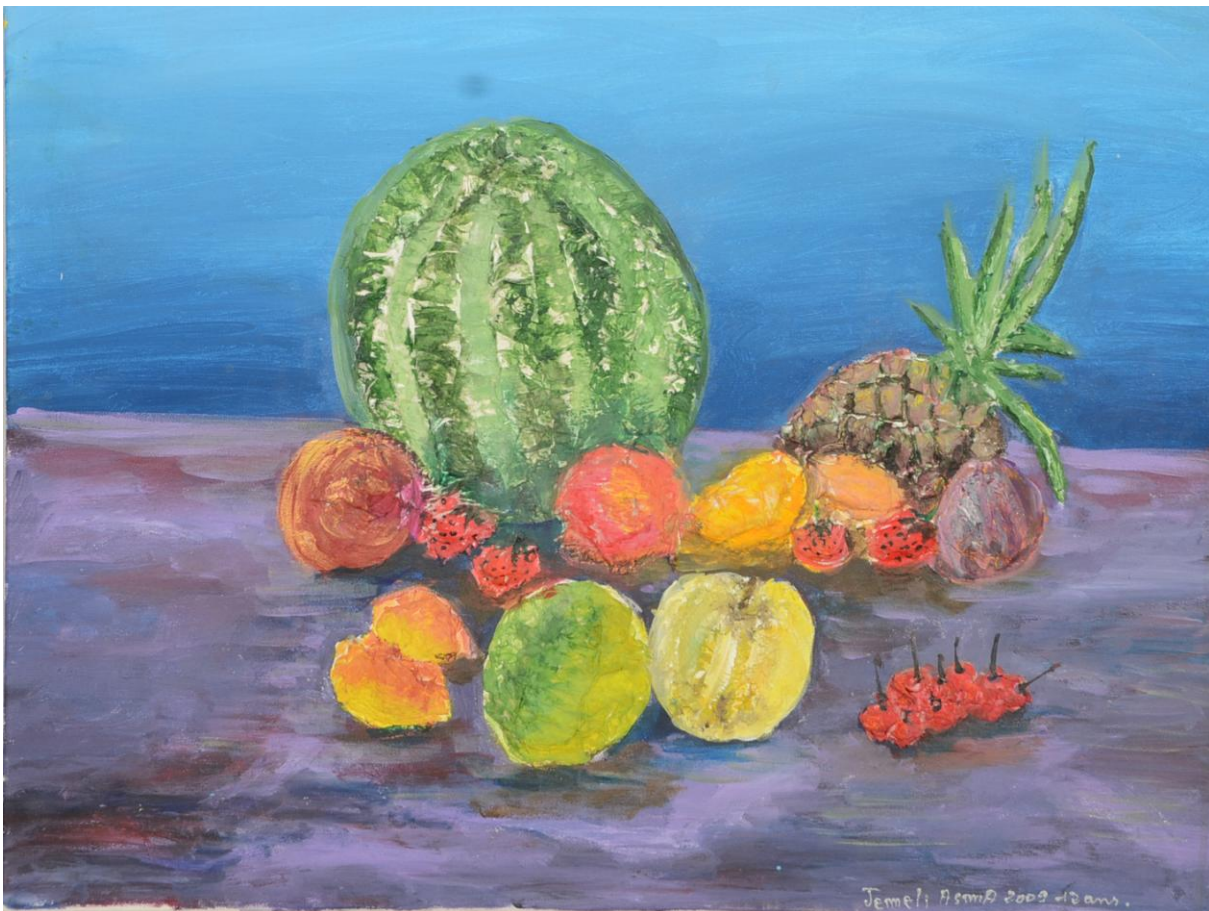
Nature morte avec peinture acrylique texturisée et technique de collage