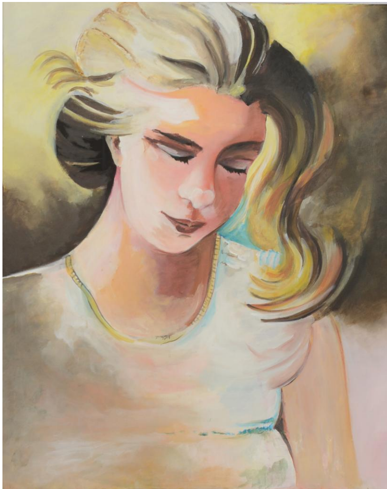
Portrait avec peinture acrylique sur toile