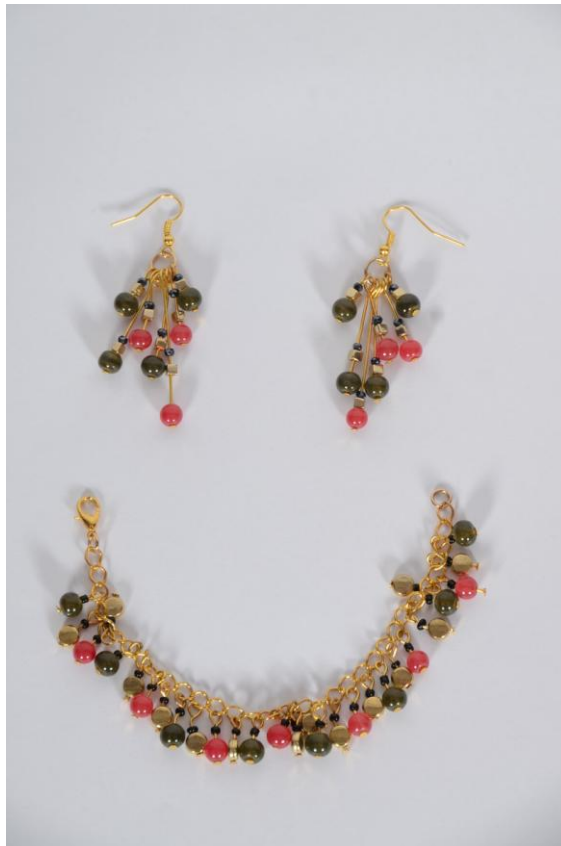
Bijoux en perles noires, rouges et verts