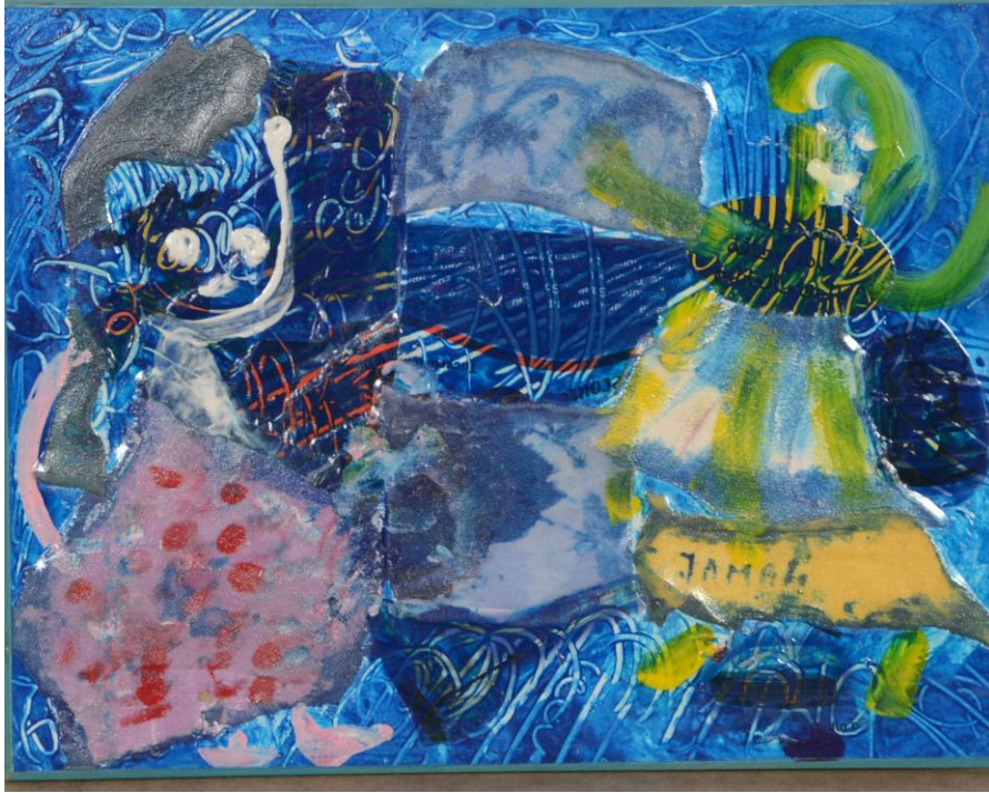
Mon premier travail réalisé lorsque j'avais six ans ; Application de la peinture acrylique sur une surface en relief effectuée par collage.