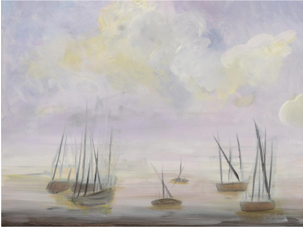
Peinture acrylique sur une toile réalisée en 2009.