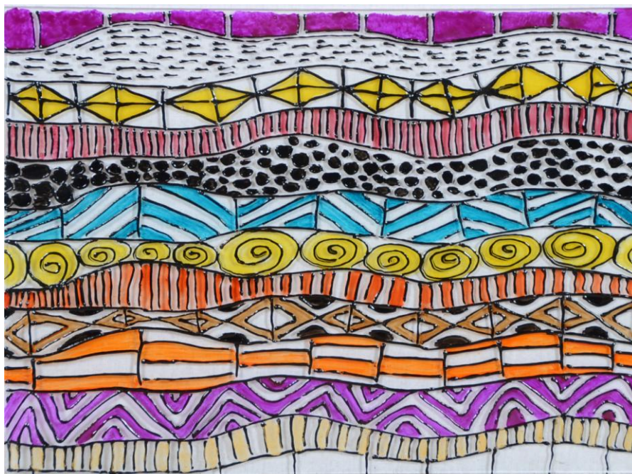
Peinture sur verre