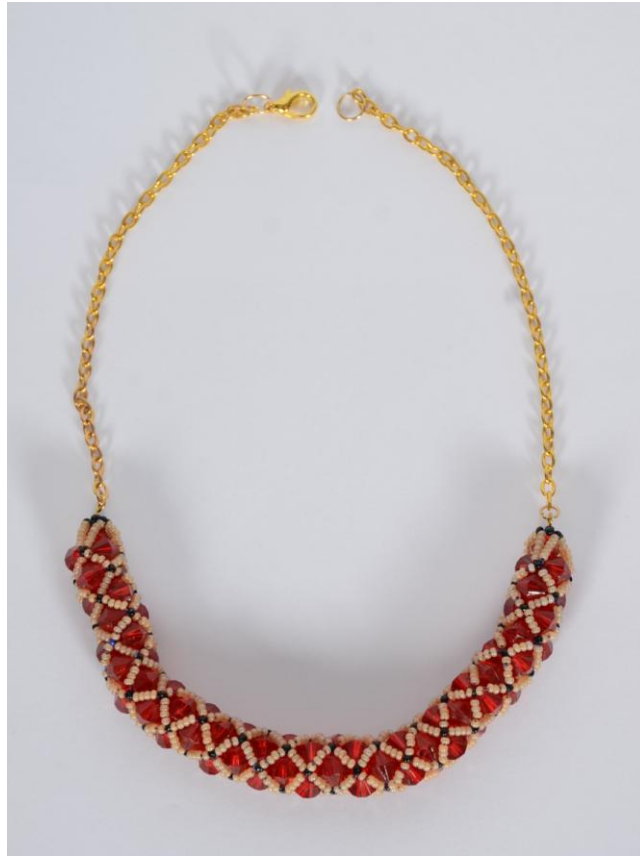
Collier en perles rouges et noires