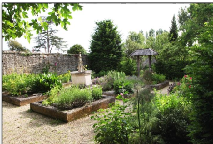
Une partie du jardin médiéval, les carrés des simples...