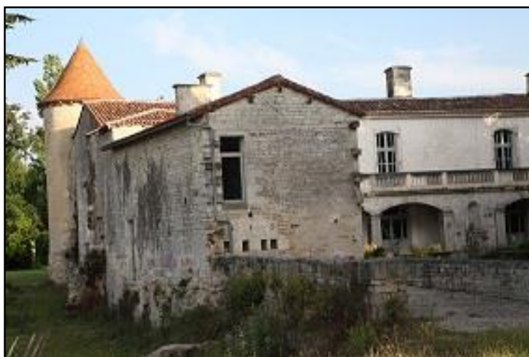
Le Couvent des Hommes...

Panorama de la façade et de la cour du musée