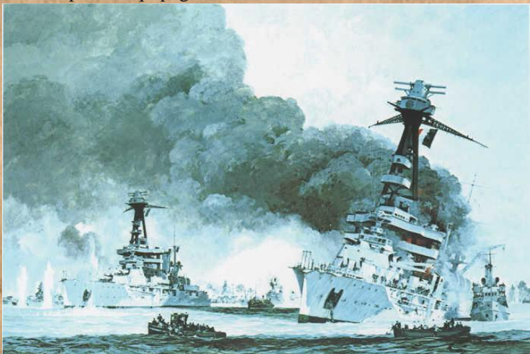
Un croiseur fume anormalement... bien avant le debut de la bataille.

La nouvelle nous est parvenue ce matin, toute la flotte à été détruite au cours d'une bataille contre la Kriegsmarine. Les quelques marins survivants ramené en hydravion raconte l'euphorie générale qui s'empara de tout les équipages lorsqu'ils filèrent à pleine vitesse vers l'ennemi, riant aux éclats alors que les premières salves allemandes sifflaient au dessus de leurs têtes. L'amirauté FNFL à lancée une enquete. Elle soupçonne les cuisiniers indochinois d'avoir une fois de plus rajouté de l'opium de la soupe des equipages.