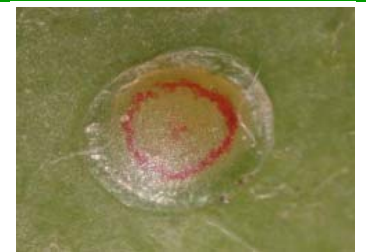
Oeuf près de l'éclosion