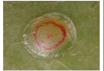
البيضة قبيل مرحلة الفقس