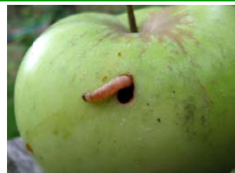
Trou de sortie de la chenille