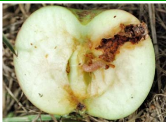
Dégâts sur fruits