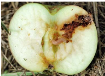
الخسائر على الثمار