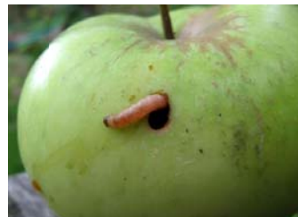
فتحة خروج اليرقة