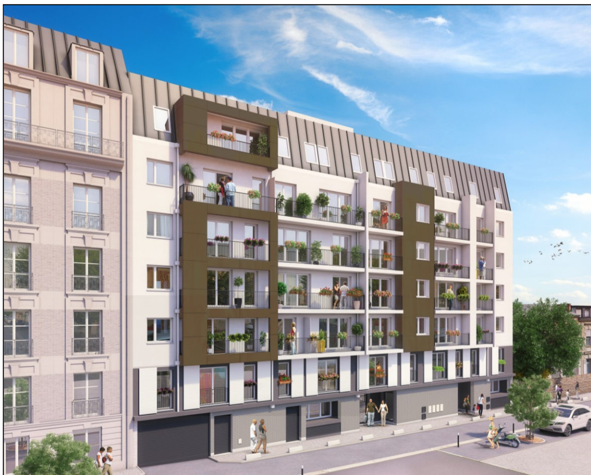
Illustration à caractère d'ambiance non contractuelle