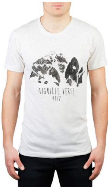
T-shirt Aiguille Verte