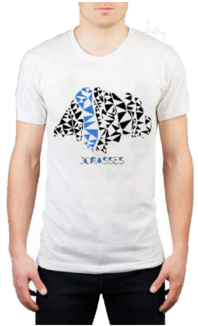
T-shirt Grandes Jorasses