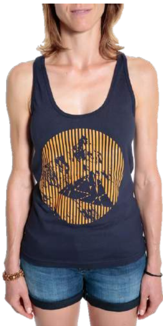
Débardeur femme Nuptse