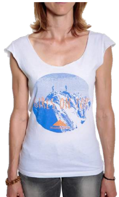
Haut femme Girls on Top