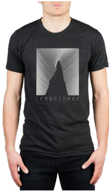
T-shirt Cerro Torre