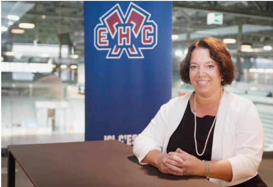
Maintenant que le HCB habite à la Tissot Arena, Stéphanie Mérillat espère pouvoir se contenter d'un sponsoring «plus classique». ANNE-CAMILLE VAUCHER

Retrouvez toute l'actualité du HC Bienne sur notre site internet.