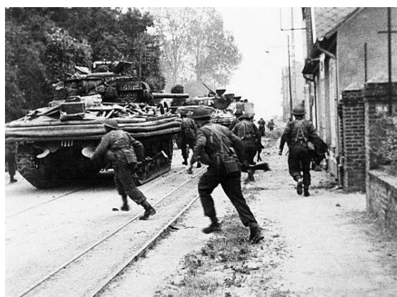
Avancée des troupes britanniques avec un char DD (Hobart's Funnies).

Sword [7] avec pour objectifs initiaux de prendre le central téléphonique et le casino de Ouistreham [2] , puis la prise du secteur de Pegasus Bridge [4] . Léon Gautier, l'un des 177 membres des commandos Kieffer, participe à la totalité de la bataille de Normandie, soit 78 jours [3] . Il ne participe pas aux combats au Pays-Bas à cause d'une blessure à la cheville [4] .