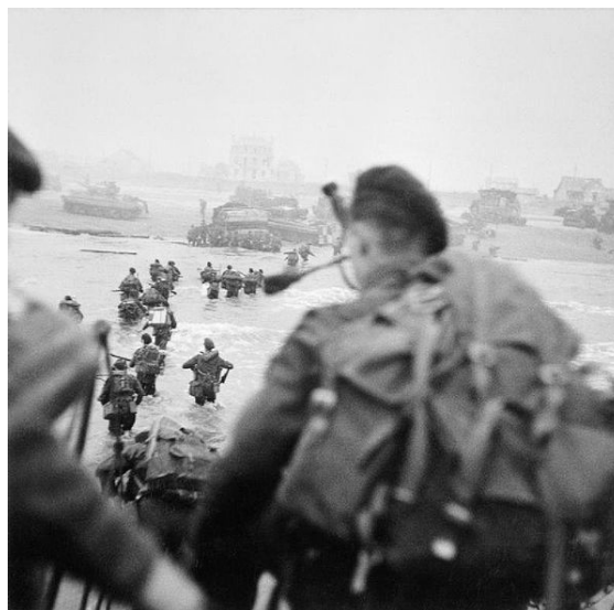
Débarquement de troupes britanniques dans le secteur Sword. Bill Millin (premier plan) et Lord Lovat (à droite dans la colonne) sont visibles.

Fin mai 1944 il est averti des préparatifs du Débarquement de Normandie [6] et le 6 juin, il débarque avec le No. 4 Commando à Colleville-sur-Orne [2] (désormais Colleville-Montgomery) dans le secteur