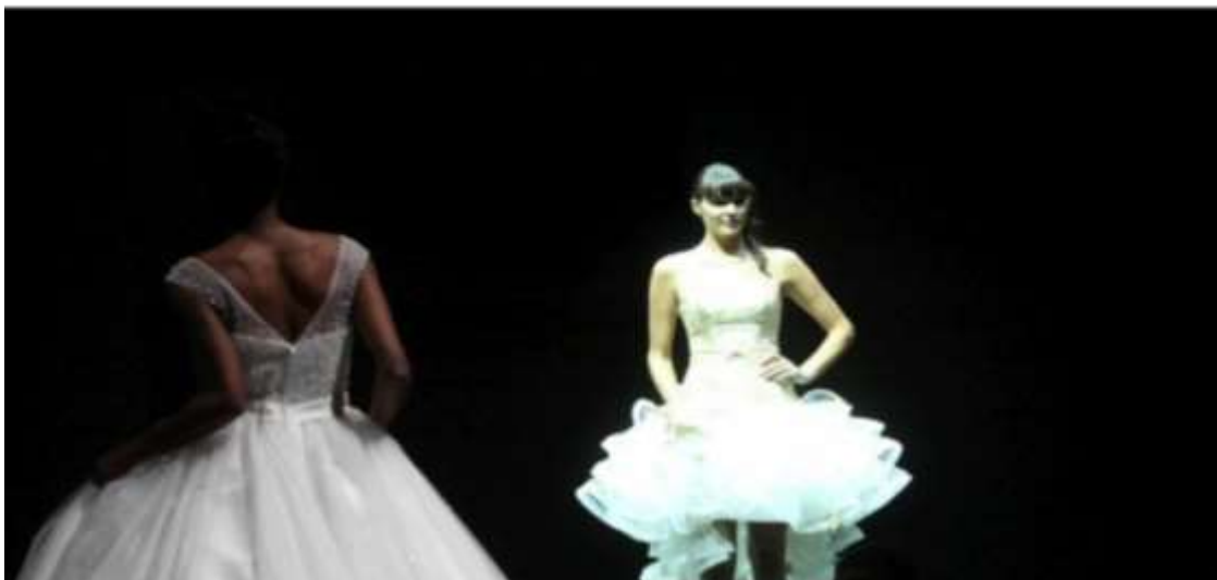
Le Salon du mariage se tient au Casino de Biarritz