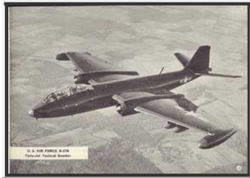
Photo original ou ne figure aucune trace d'ovni dans le ciel. Le défaut, du à une poussière puis à un grattage du négatif n'apparaîtra que plus tard. C'est à ce moment que les " ufologues " s'emparent du cliché...