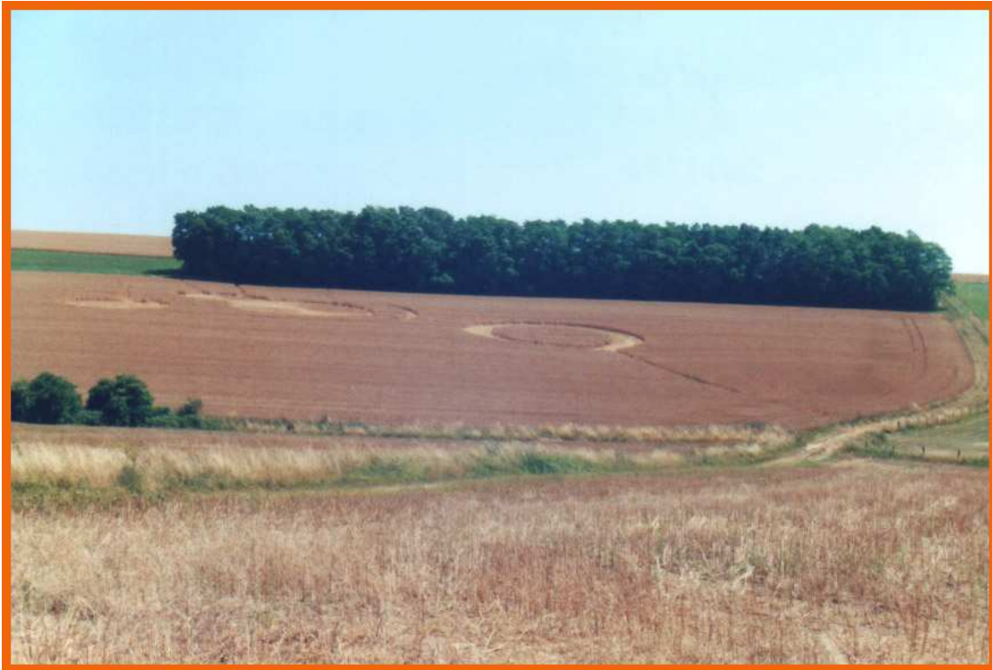
Raoul Robé au bord de l'anneau

Photographie du pictogramme depuis le chemin qui mène au site