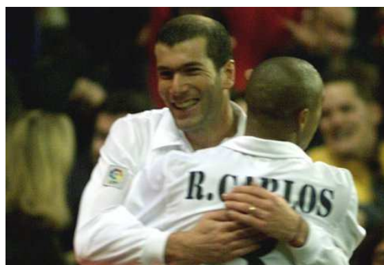
Zidane et Roberto Carlos coéquipiers au Réal Madrid

Une autre personnalité importante intègre son staff, l' un des plus grands joueurs à son poste d' arrière gauche, Roberto Carlos.