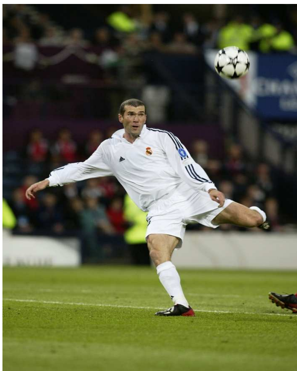
Zidane en finale de Ligue des Champions contre Leverkusen

Il remporte avec le Real Madrid la compétition la plus prestigieuse européenne, la Coupe du Monde et le ballon d' Or en 1998 et l' Euro 2000 avec l' équipe de France.