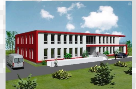
Nouveau Champions Education Center