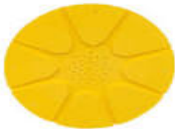
Chasse abeille 8 sorties 510TTC