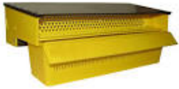
Trappe à pollen 1 800TTC