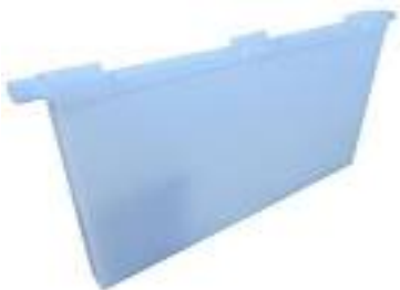
Nourrisseur cadres Langstroth 3kg 2 100TTC