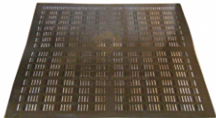
Tapis à propolis 800TTC