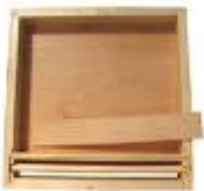
Nourrisseur couvre cadres bois pour ruche 2 600TTC