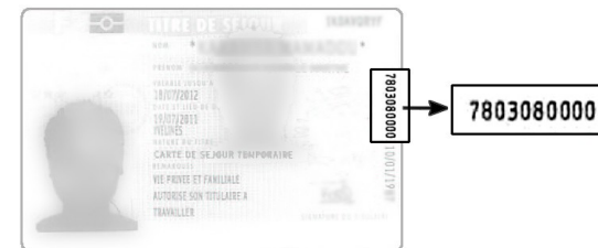
Nouveaux titres de séjour