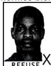
Photo ni sombre, ni tachée, ni coupée