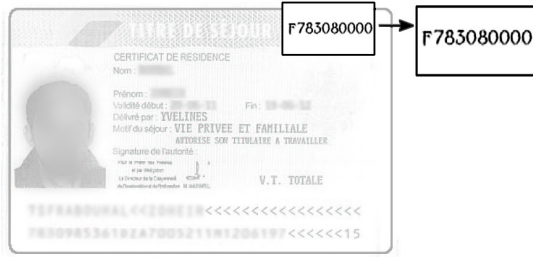
Anciens titres de séjour