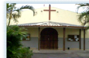
RIVIÈRE DES GALETS