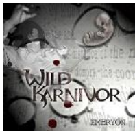
Embryon (Great Dane records 2007)