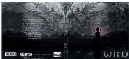
Purgatorius (Over Powered Records 2017)