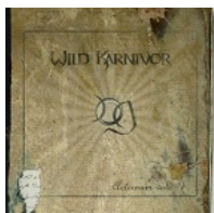
Aeternum Vale (Great Dane Records 2009)