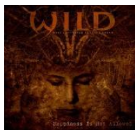
Happiness is not Allowed (Free Download 2015)