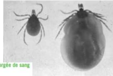
Tique non gorgée et tique gorgée de sang

Son repas dure de 3 à 10 jours au cours desquels le volume de la tique augmente fortement.