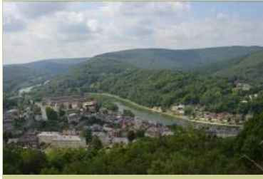
Vallée de la Meuse: Monthermé, les quatre fils Aymon, juin 2015, photo Eric MENY.