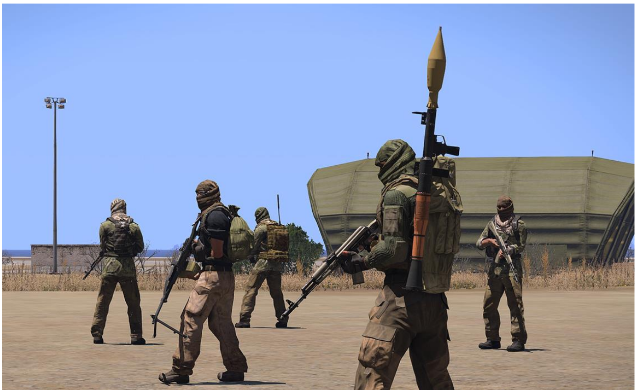
Guerillos d'élite sur le terrain

Lorsque l'on voulait rejoindre le groupe il fallait être riche, très riche, et il fallait passer les tests d'entrer qui était très éprouvant pour le candidat il était testé par nous trois, une minorité d'entre eux avais le privilège de rentrer dans notre organisation. Nous les mettions alors au grade de recrue, il devait faire leurs preuves, ensuite il passait à celui de guerillos qui était le corps de notre organisation. Et il y avait les guerillos élite, les personnes, pour atteindre ce grade, devait maitriser tous ce qui était possible à maitriser en matière d'arme, de véhicule, de tactique, etc. et ensuite relevé un défi d'une difficulté extrême. Une fois élite il devenait la terreur de l'île, la police avait peur d'eux, une simple patrouille de police avait pour ordre de fuir devant un seul d'entre eux.