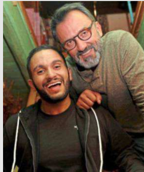
L'humoriste Malik Benthalha au côté de l'animateur Frédéric Lopez.

Mongolie, Islande, Irlande ? Non ! Frédéric Lopez a emmené Malik Benthalha dans les Cévennes !