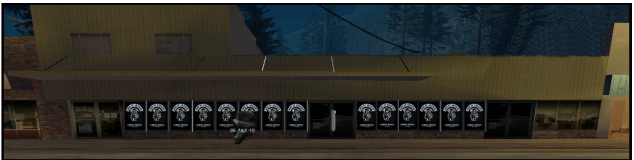
Bar des Sons Of Anarchy, Angel Pine

Pour les Sons, le bar joue un rôle particulièrement important. C'est leur couverture légale, ici que les réunions se passent, les décisions importantes pour le Club y sont donc prises, les prospects seront intégrer au MC dans ce bar. C'est aussi ici que les fêtes entre les membres du club seront organisé, la plupart du temps ce sont les régulière ( les femmes des membres ) qui organisent ces fêtes.