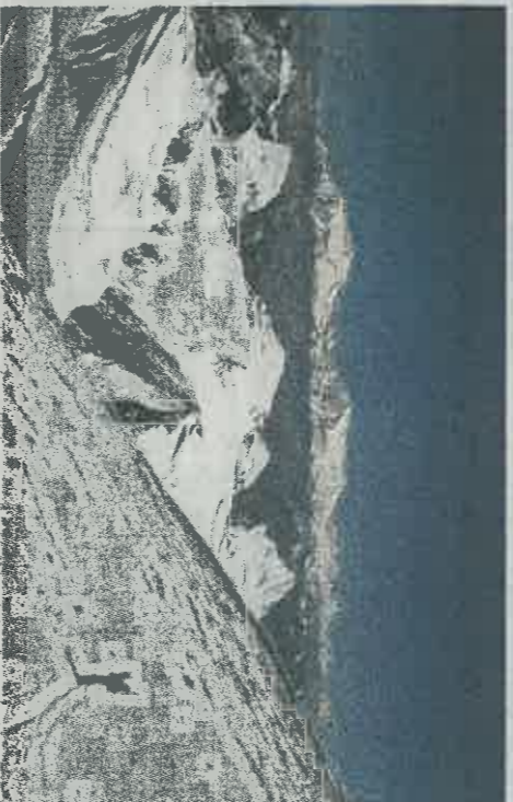
L'une des aventures qui l'a le plus marqué : l'ascension de l'Aconcagua (6 962 mètres), en Argentine

valent la pente et, par chance, croisent un 4x4 qui les ramène en zone sûre. « Il avait le pare-brise cassé par les pierres qui pleuvaient. Ce jour-là il y a eu des cendres jusqu'à 40 kilomètres du volcan », se souvient Yannick.