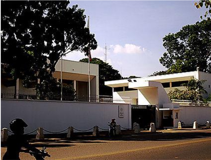
Ambassade de France au Cambodge