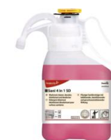
DETERGENT DETARTRANT DESINFECTANT DESODORISANT 4 EN 1 SMART DOSE