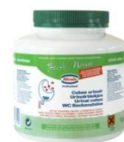
CUBES URINOIRES FRESH MOUSSE POT 1KG