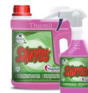
NETTOYANT DETERGENT ANTI- CALCAIRE SANYOS BIDON 4L OU PULVE 750ML