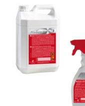
NETTOYANT DETERGENT ANTI- CALCAIRE SANITAIRE BIDON 5L OU PULVE 750ML