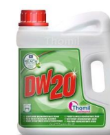
NETTOYANT DESINCRUSTANT ACIDE DW20 BIDON 4L