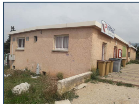
Exterieur actuel du stade