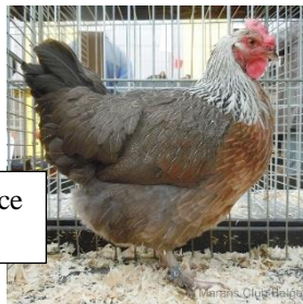
Poule Marans saumon argenté grande race