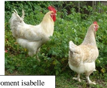
Couple de Marans froment isabelle