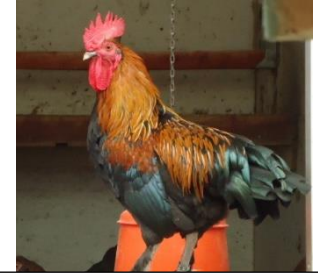
Coq noir à camail cuivré nain