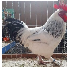
Coq blanc herminé noir (grande race)